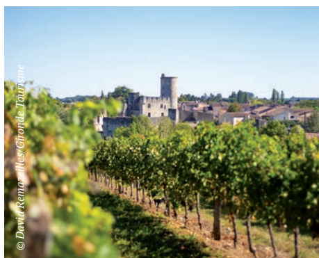
Bild unten | Das Weinbaugebiet Bordeaux, auf Französisch Bordelais, ist das größte zusammenhängende Anbaugebiet der Welt für Qualitätswein.

Wie kam das Département Gironde zu seinem Namen? Zwei der bedeutendsten Flüsse der Region, die Dordogne und die Garonne, vereinen sich hinter der Hauptstadt Bordeaux zur Gironde – et voilà! Entlang der Gewässer und Kanäle geht es mit dem Fahrrad durch die sonnendurchflutete Landschaft im Südwesten Frankreichs, die geprägt ist von Weinbergen, Kiefernwäldern und hübschen Dörfern.