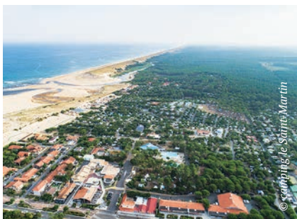
Bild links | Luftaufnahme des Campingplatzes »Le Saint Martin« in Moliets.

Biscarrosse verzaubert mit einem etwa fünf Kilometer langen feinen Sandstrand, drei Seen, die über einen Kanal miteinander verbunden sind und auch die höchste Wanderdüne Europas, die Düne von Pilat, ist von Biscarrosse aus gut mit dem Fahrrad zu erreichen. Es führt uns weiter nach Mimizan, eine Stadt, die auch »Perle der Silberküste« genannt wird. Hier gibt es zehn Kilometer Sand mit sechs überwachten Stränden, davon ein wellengeschützter