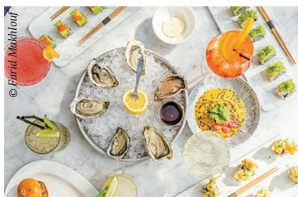
Bild links | Frisch und lecker: Verpassen Sie nicht eine Austernverkostung auf der Île de Ré und der Île d'Oléron!

Tipp: Für Familien ist das Aquarium von La Rochelle spannend, hier kann man über 12.000 Meerestiere staunen.