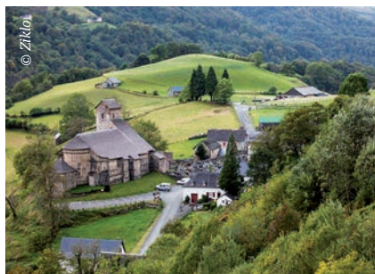
Bild unten | Auf einer Bergpässe-Tour im Baskenland entdeckt man auch hübsche, kleine Gemeinden wie hier Sainte-Engrâce.

Zur geographischen Einordnung: Das französische Baskenland grenzt an die spanischen Autonomen Gemeinschaften Navarra und Baskenland im Süden, im Westen an den Golf von Biskaya, im Norden an das französische Département Landes und an die historische Provinz Béarn im Osten. Längs der Südgrenze verläuft der westlichste Teil der Pyrenäen.