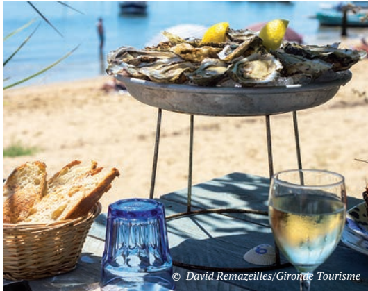
Großes Bild links | Bade-Zwischenstopp in Soulac-sur-Mer. Bild ganz oben | Fahrradtour entlang des Flusses Garonne in Bordeaux. Bild oben | Gourmet-Pause an der Bucht von Arcachon.

Bei einem Spaziergang oder Radtour durch die Stadt fühlt man sich in eine andere Epoche versetzt und staunt über mehr als 350 Denkmäler.